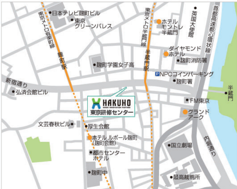
株式会社 白鵬 東京研修センター

株式会社白鵬 東京研修センター 〒102-0083 東京都千代田区麹町2-3-3 FDC麹町ビル10F TEL : 03-3265-6252